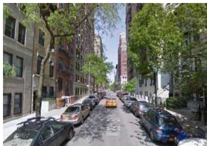
Street View : W 99TH St.