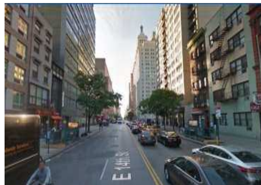
Street View : E 14th Street

●その他：光熱費込、プライベートシャワールーム。お部屋にはベッド、デスク、椅子、冷蔵庫、電子レンジ、トースター、コーヒーメーカーが設置されています。