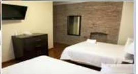
プライベートルーム 左4枚：個室 右4枚：2人部屋