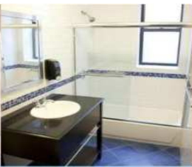
共有スペース (キッチン・バスルーム)