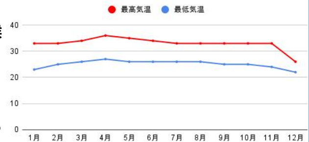
バンコク年間平均気温

人気観光地： ワット・プラケオ（エメラルド寺院）、ワット・アルン（暁の寺）、アユタヤ世界遺産、サムイ島、パタヤビーチ