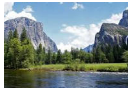
ヨセミテ国立公園