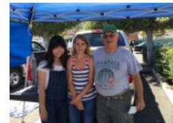
朝市ボランティア