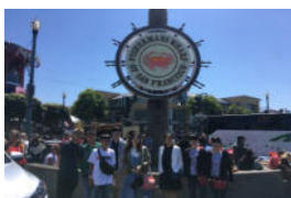
フィッシャーマンズ・ワーフ