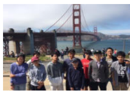
ゴールデンゲート・ブリッジ