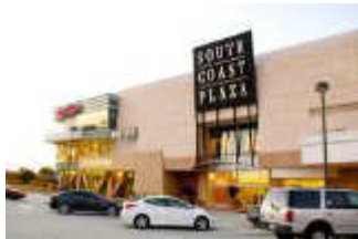
サウスコーストプラザ