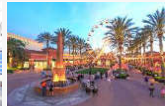
ショッピングセンター