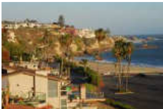
ニューポートビーチ