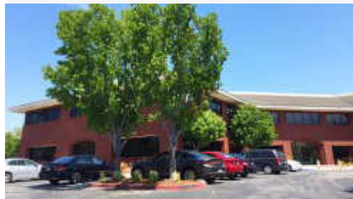
AOI は 2F にあります