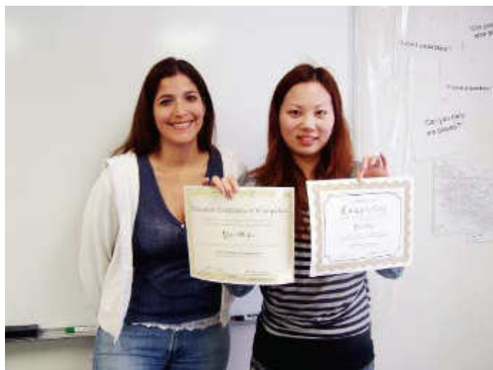
修了証がもらえます