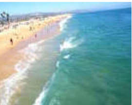
ハンティントンビーチ