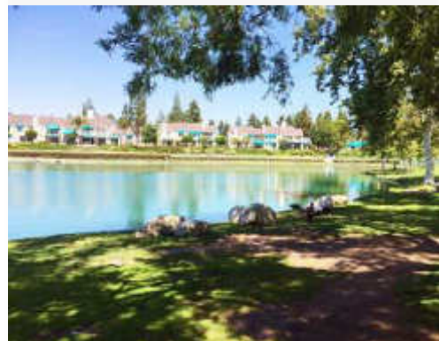
近くの公園 ノースレイク パーク