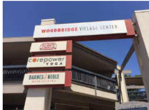
徒歩で行けるショッピング街